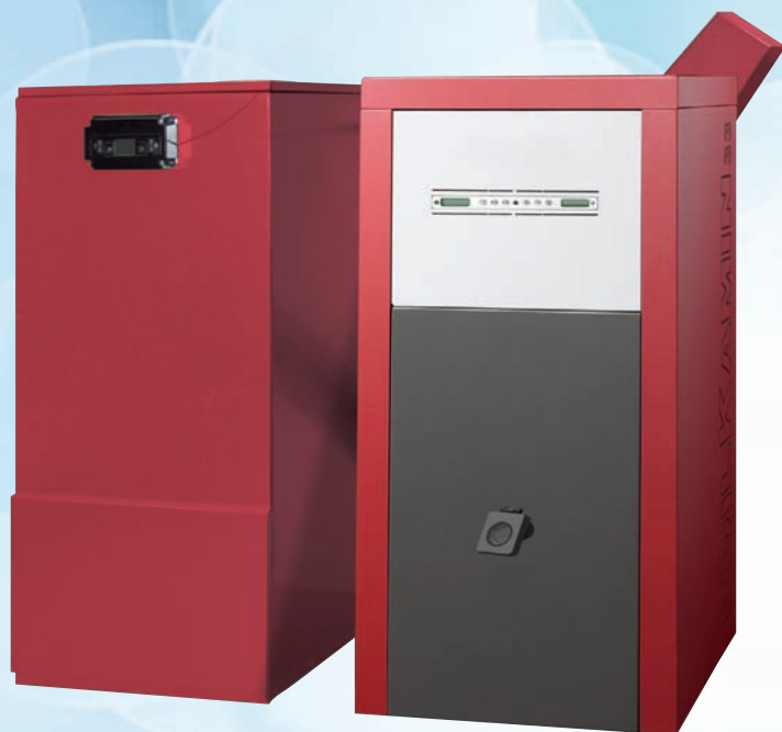
BEHÄLTER/TANK 250 kg - (60x67x132 h cm)